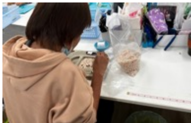
Tillverkning av smycken i Bangkok

I Bangkok har vi beslutat att fortsätta ansvara för skyddat boende för exploaterade kvinnor. De får hjälp att komma ut ur det fruktansvärda liv som de lurats in i av ett nätverk av "agenter" och bordellägare. Genom vårt stöd får de yrkesutbildning (bland annat smykestillverkning), medicinsk och psykisk rådgivning, skyddat boende, och hjälp att kunna återvända hem, många till Afrika.